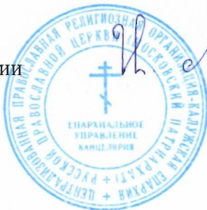
игумен Мефодий (Пронькин)